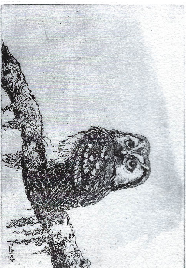
„Rauhußkauz“ Radierung 24 x 30 cm